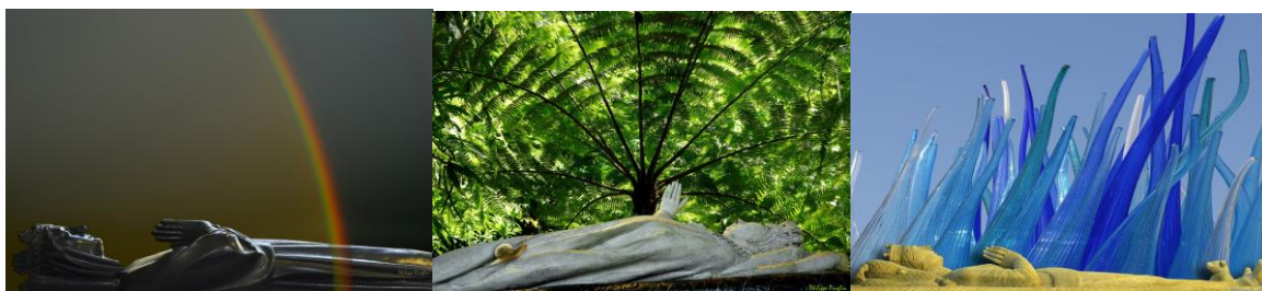
Quelques photos du film « Gisants en balade »

Né à Belleville, je suis photographe professionnel. J'ai exercé ce métier 10 ans dans le groupe Philips. Ancien secrétaire confédéral chargé des relations internationales de la CFDT, et du partenariat avec le CCFD-Terre Solidaire, j'ai parcouru le monde... Maintenant en retraite, je reprends entre autres choses la photographie, notamment pour exprimer le lien entre l'art et notre vie de chaque jour, et pour mettre en avant les talents que nous possédons toutes et tous.