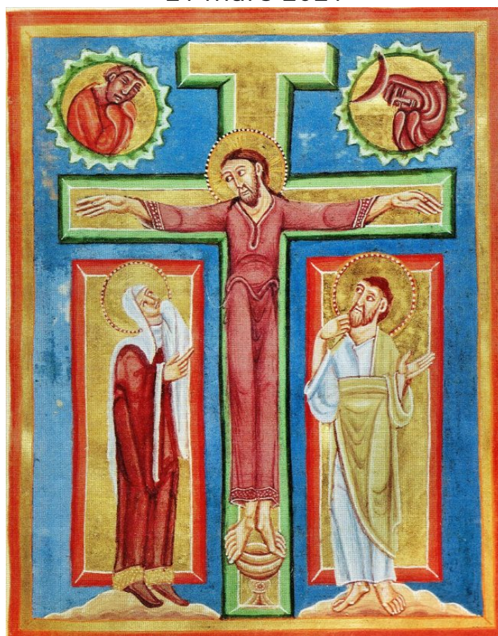
Miniature, abbaye d'Echternach au Luxembourg, du « Livre d'Évangiles » illustré par des moines du XI e siècle

Collecte du CCFD -Terre solidaire « Nous habitons tous la même maison » campagne annuelle de Carême