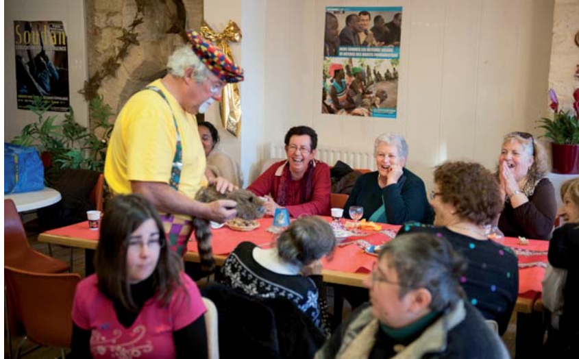
S. LECLEZIO / S.C.

Le pape n'oublie pas le souci premier de vivre cette démarche, « non pas comme une obligation, comme un poids qui nous épuise, mais comme un choix personnel qui nous remplit de joie et nous donne une identité » (279). ■