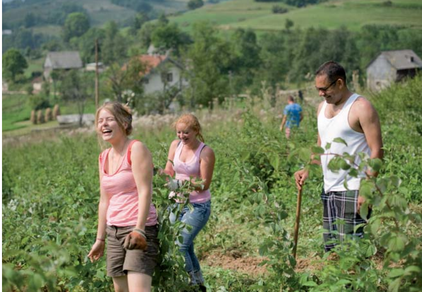
X. SCHWIBEL / S.C.

Comme pour nous encourager, nous rassurer face à l'ampleur de la tâche, le pape précise que chaque artisan de solidarité peut y contribuer joyeusement à sa manière. Répondre à l'appel de Jésus « implique autant la coopération pour résoudre les causes structurelles de la pauvreté et le développement intégral des pauvres, que les gestes simples et quotidiens de solidarité devant les misères très concrètes que nous rencontrons » (188). Le service du frère, vécu comme la participation à un banquet festif auquel tous sont invités !