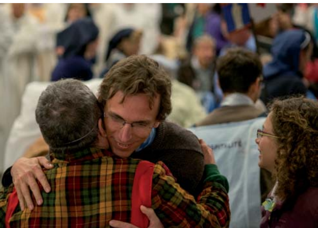
X. SCHWIBEL / S.C.

Le pape François appelle les catholiques à la conversion individuelle, collective, pastorale et missionnaire. Cette conversion a un caractère permanent et s'enracine dans le partage de la Parole de Dieu et la prière.