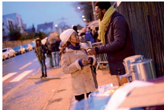
G. KERBAOL / S.C.

Cette annonce du cœur de la foi doit, pour atteindre le plus grand nombre, tenir compte du contexte : « Dans le monde d'aujourd'hui, avec la rapidité des communications et la sélection selon l'intérêt des contenus opérés par les médias, le message que nous annonçons court plus que jamais le risque d'apparaître mutilé et réduit à quelques-uns de ses aspects secondaires. Il en ressort que certaines questions qui font partie de l'enseignement moral de l'Église demeurent en dehors du contexte