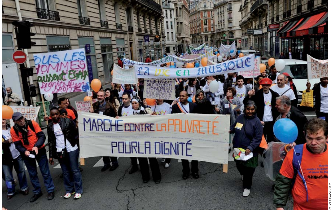
C. KERBAOL / S.C.