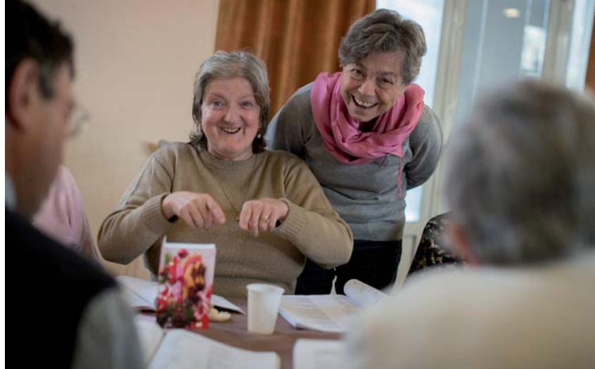
E. PERRIOT / S.C.

Le Pape développe ensuite la place privilégiée des pauvres dans le Peuple de Dieu, dans un langage qui rejoint la démarche Diaconia de l'Église en France : « Les pauvres ont une place de choix dans le cœur de Dieu, au point que lui-même "s'est fait pauvre" (2 Co, 8, 9). Tout le chemin de notre rédemption est marqué par les pauvres. » (197)