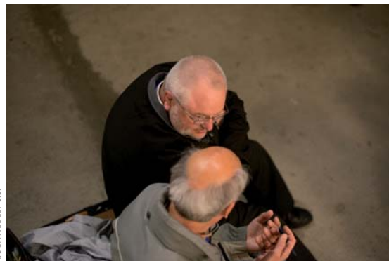
X. SCHWABEL / SC.

« Unis à Jésus, cherchons ce qu'il cherche, aimons ce qu'il aime. Au final, c'est la gloire du Père que nous cherchons, nous vivons et agissons "à la louange de sa grâce" (Ep 1, 6). » (261) ■