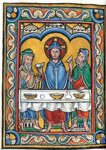
Miniature Vita Christi 12 ème

Quand il fut à table avec eux, ayant pris le pain, il prononça la bénédiction et, l'ayant rompu, il le leur donna.