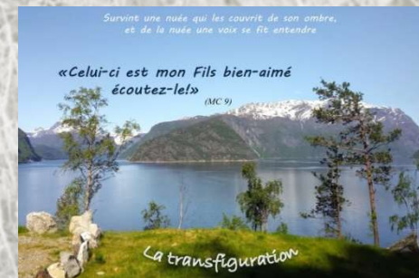
2 ème dimanche de carême