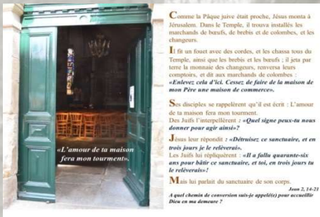
3 ème dimanche de carême