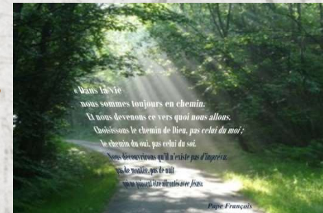
4 ème dimanche de carême

“ Vous serez mes témoins dans tous vos chemins de vie ”