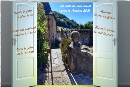
5 ème dimanche de carême

“ Vous serez mes témoins dans tous vos chemins de vie ”