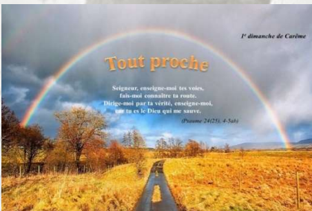
1 er dimanche de carême