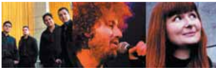
Simón Bolívar Quartet Venezuela

Car côté musique, l'Amérique latine s'est imposée au monde, et voilà bien longtemps. Qu'il s'agisse du tango argentin, patrimoine mondial de l'humanité, aux boléros mexicains en passant par les rythmes irrésistibles de salsa cubaine, que notamment Buena Vista Social Club a contribué à faire renaître. Métis explore quelques-unes de ces nombreuses facettes. Le bandonéon de Piazzola, le baroque mexicain revisité par Christina Pluhar jusqu'au très électrique et mondial Gotan Project pour la grande fête sur le parvis et un « nouveau » Mexique, traditionnel et électro avec la création du musicien mexicain Murcof dans la Basilique. La musique latino : une musique à danser qui donne à penser.