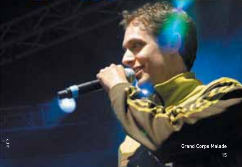
Grand Corps Malade