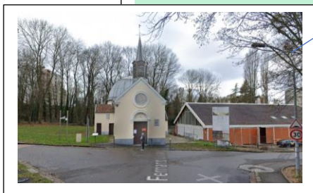
Chapelle Notre. Dame des Anges et église St Jean XXIII

Divorcés et en Église 93 Mail : divorceseteneglise93@gmail.com