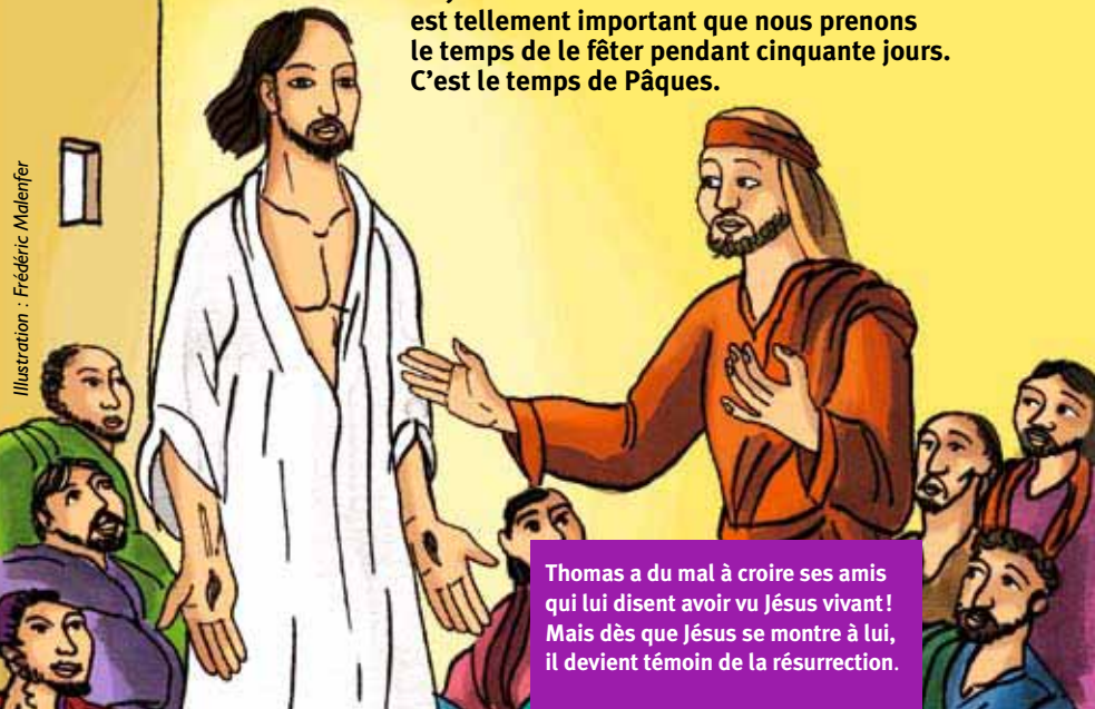
Illustration : Frédéric Malenfer

Thomas a du mal à croire ses amis qui lui disent avoir vu Jésus vivant ! Mais dès que Jésus se montre à lui, il devient témoin de la résurrection.