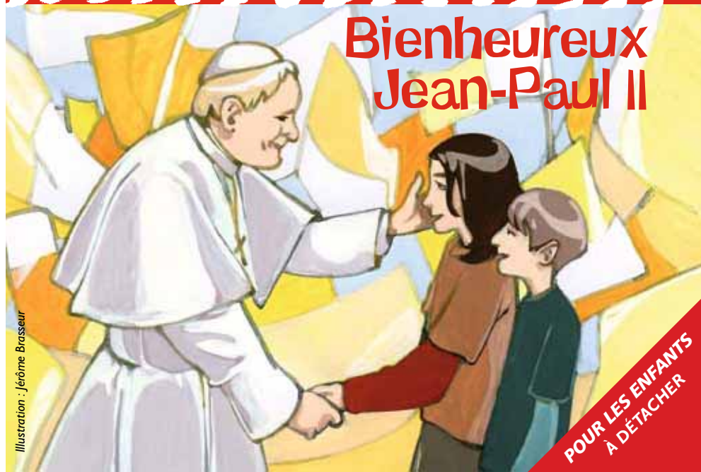
Illustration : Jérôme Brasseur