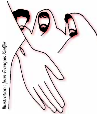
Illustration : Jean-François Kieffer

... dans une synagogue, préfiguration de l'audacieuse démarche de repentance qu'il initia ensuite pour toutes les fautes commises par les chrétiens au fil de l'Histoire. On se souvient également de la Journée de prière pour la paix organisée à Assise, en présence de nombreux chefs religieux. Désireux d'apporter à tous la parole du Christ, Jean-Paul II effectua plus de cent voyages hors d'Italie ! Ses visites à sa chère Pologne précipitèrent l'effondrement du bloc communiste. Par les Journées mondiales de la jeunesse, il parvint aussi à créer un lien fort et nouveau avec les jeunes.