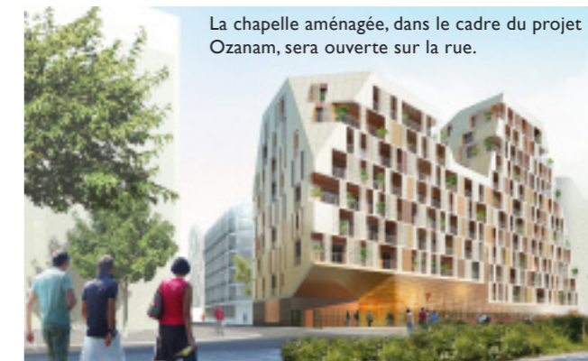
La chapelle aménagée, dans le cadre du projet Ozanam, sera ouverte sur la rue.

L'histoire continue. L'enjeu des Chantiers du Cardinal pour les années à venir est considérable. L'Église continue à bâtir des édifices au cœur des villes. Ils répondent à l'évolution de la société.