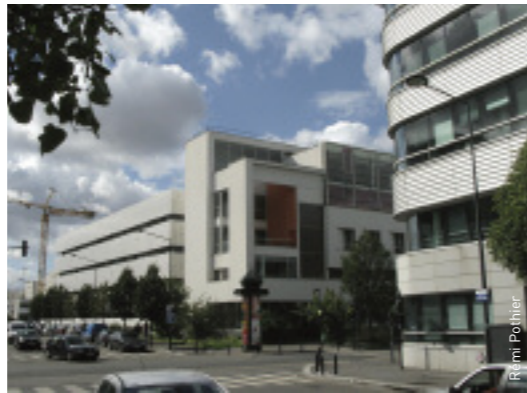
A la Plaine-Saint-Denis, les sièges d'entreprises côtoient les immeubles d'habitation.

Mais le curé est confiant, le lieu sera ouvert vers l'ex-