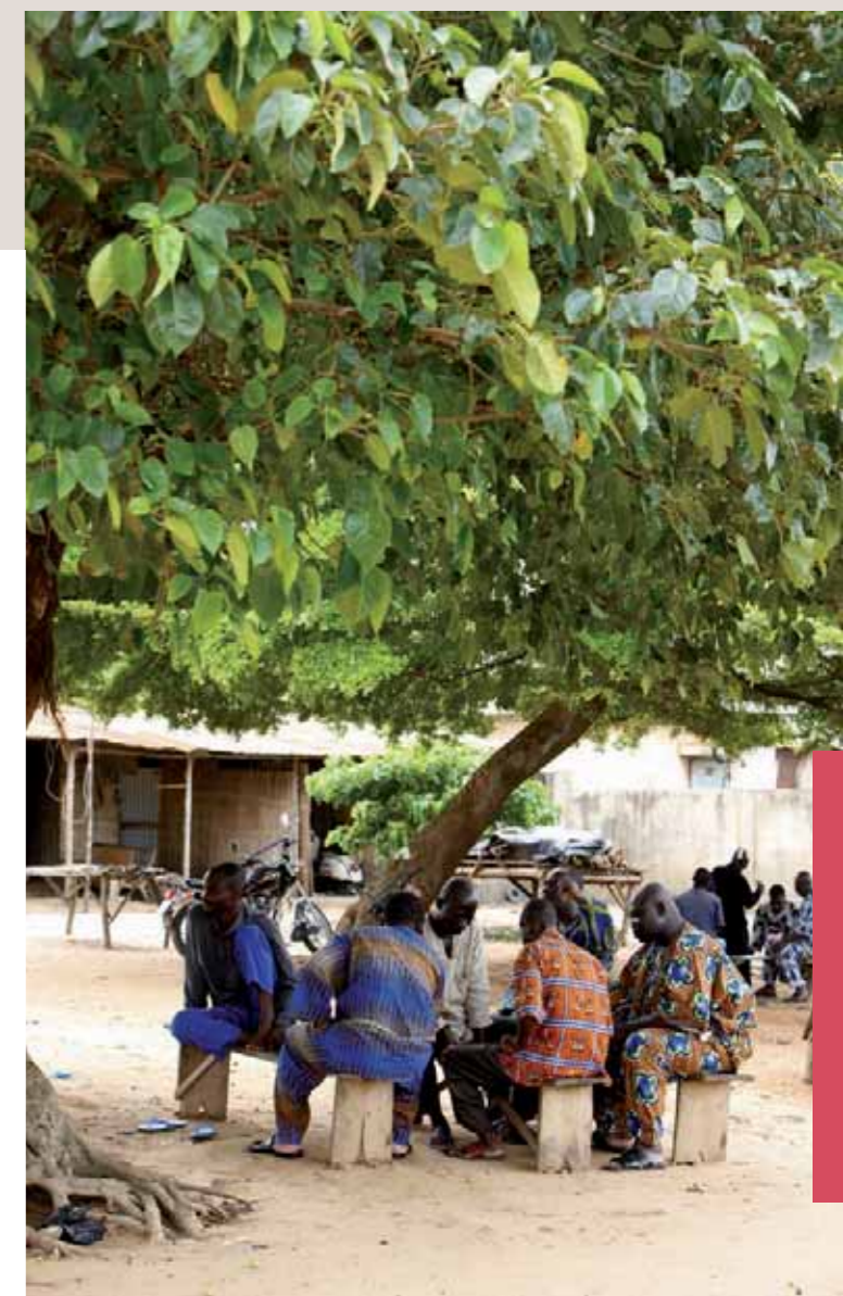
Arbre à palabres, Afrique