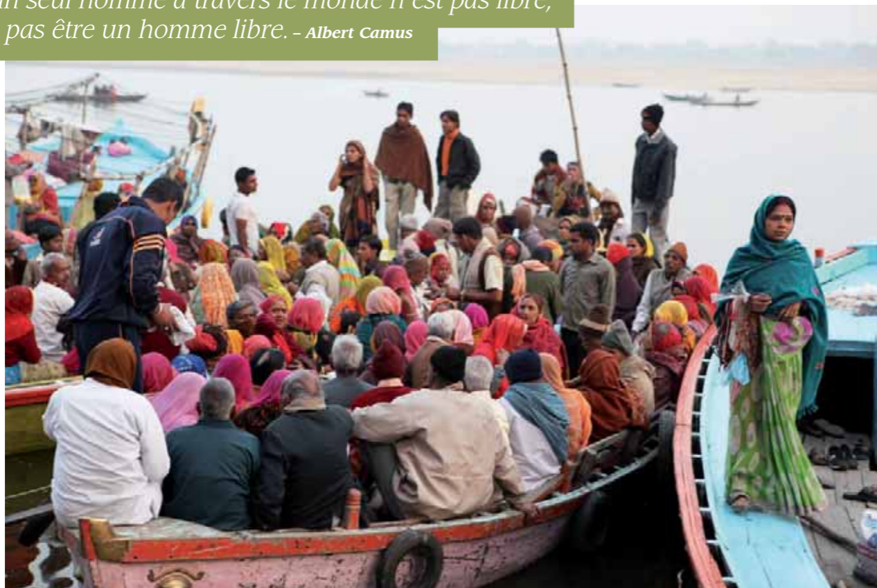
Bénarés, Inde

« Tant qu'un seul homme à travers le monde n'est pas libre, je ne peux pas être un homme libre. - Albert Camus