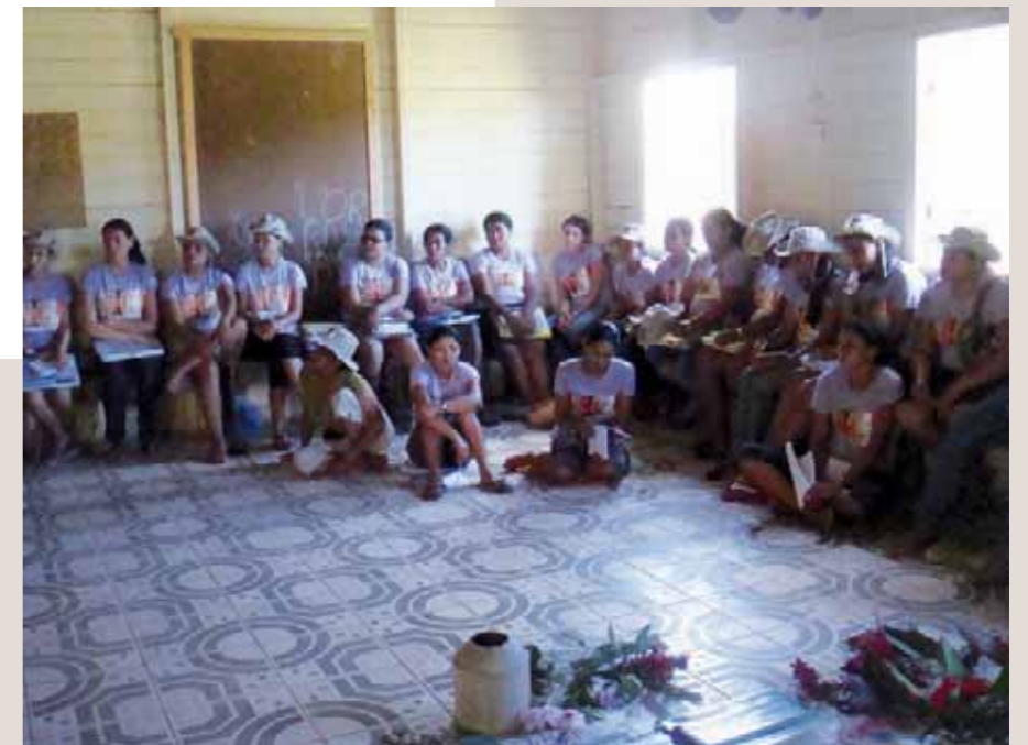
Promotrices en atelier

Le CCFD soutient la Commission pastorale de la terre (coordination nationale et section de l'État de l'Acre, Amazonie) depuis 1980, avec un montant de 80 000 € par an.