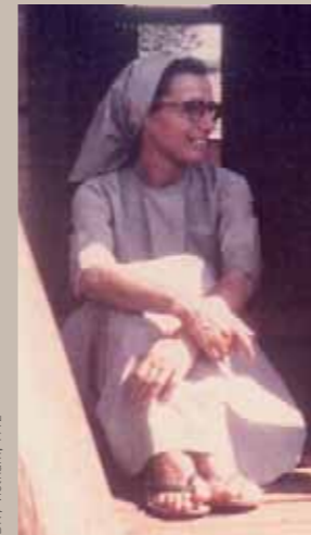
DR / Vietnam, 1972