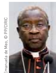
Emanuela de Mee, © PPI/CIRC Théodore Adrien Cardinal Sarr archevêque de Dakar

Commission sociale des évêques de France, Réhabiliter la politique, § 12, 1999.