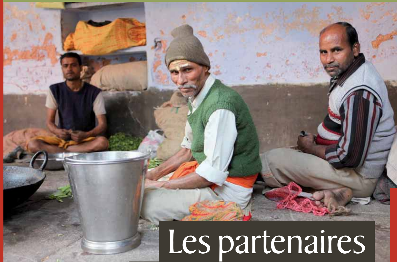
Bénarès, Inde