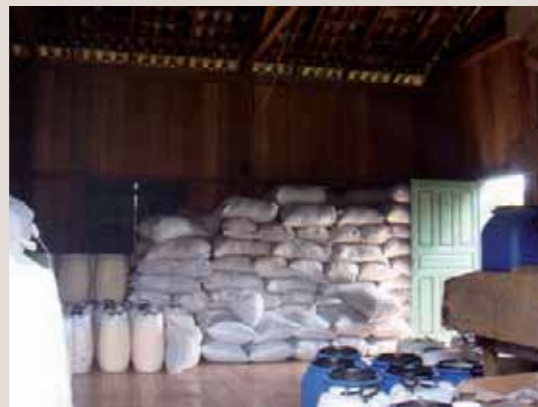
Produits de la forêt