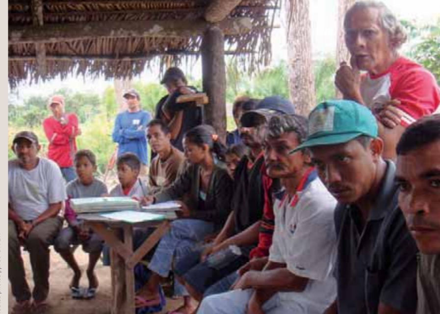
Assemblée de paysans