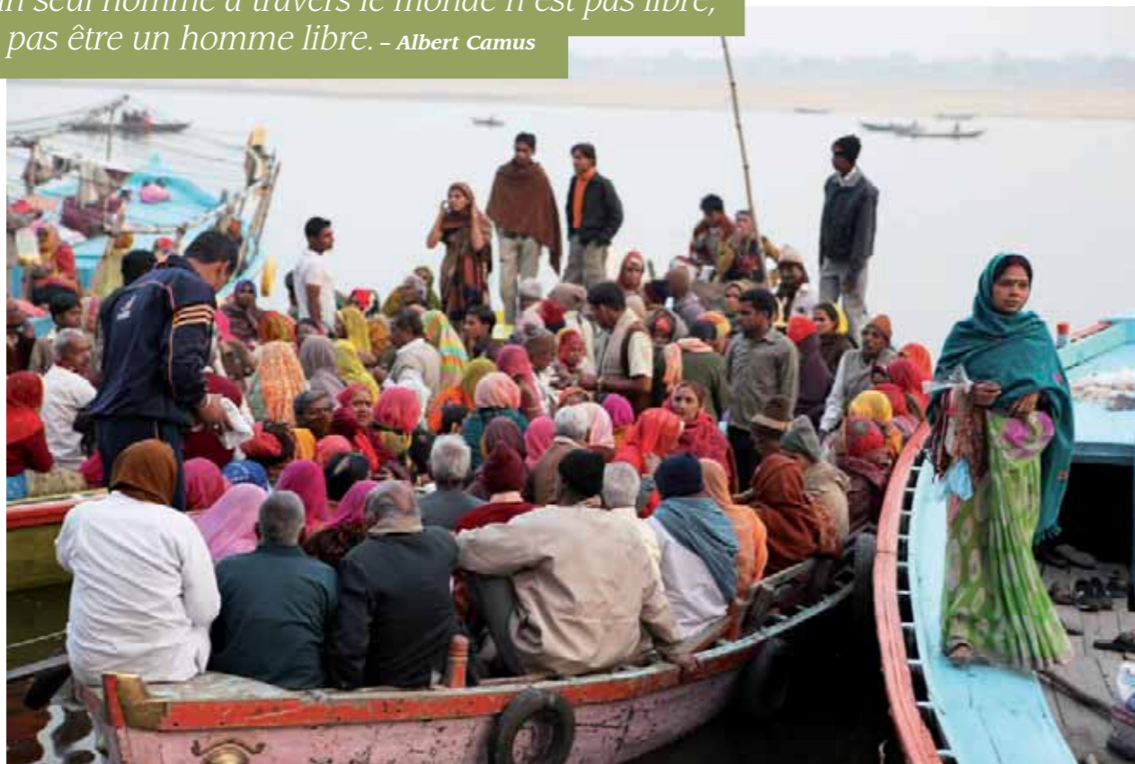
Bénarés, Inde

« Tant qu'un seul homme à travers le monde n'est pas libre, je ne peux pas être un homme libre. - Albert Camus