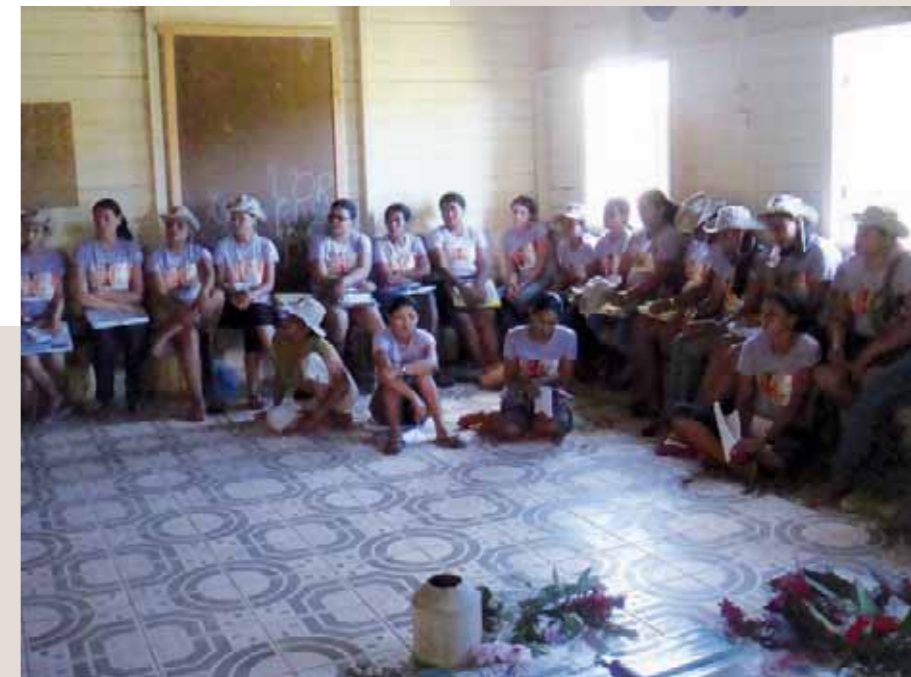
Promotrices en atelier

Le CCFD soutient la Commission pastorale de la terre (coordination nationale et section de l'État de l'Acre, Amazonie) depuis 1980, avec un montant de 80 000 € par an.