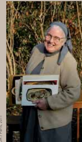
Paris, 2011

Elle entre au monastère de Vanves en 1943. Onze ans plus tard, elle a 30 ans, elle est envoyée au Vietnam, en pleine guerre, avec quatre autres jeunes sœurs : une autrichienne, une arménienne, une vietnamienne et une française. Elle eut très vite l'intuition que pour vivre une authentique rencontre, il fallait prendre en compte le plus profondément possible la culture locale, quitte à remettre en question ses propres schémas. C'était un immense désir. Elle vit aujourd'hui à Paris. À 88 ans, elle nous parle avec conviction et émotion de ces 21 ans qui ont tellement marqué sa vie.