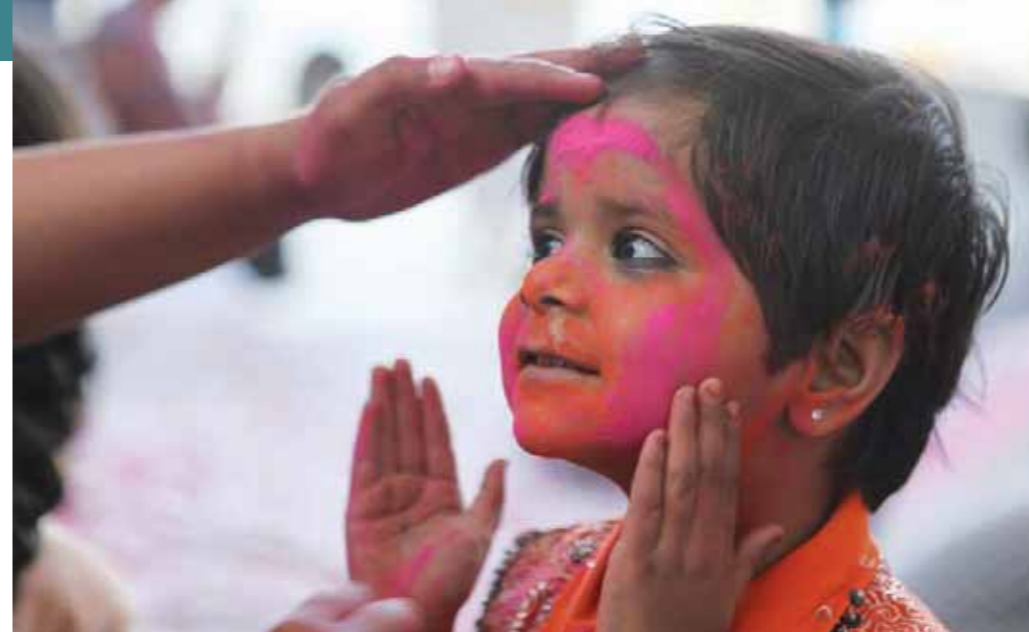
Fête de Holi (fête des couleurs), Pushkar, Inde.

Pour nous associer à cette attitude, pour l'offertoire, nous pouvons offrir un plat rempli de graines, des photos de partenaires, une carte du monde et la quête.