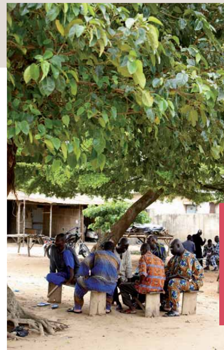
Arbre à palabres, Afrique