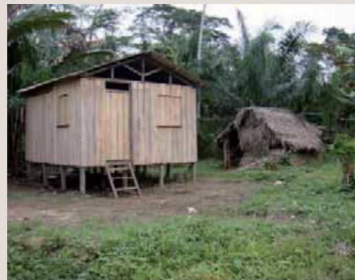
Maison de paysans sur leurs nouvelles terres