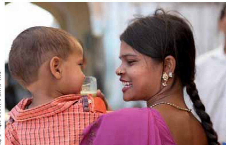
Jodhpur, Rajasthan, Inde

Dans chaque Équipe locale, les idées et initiatives ne manquent pas pour vivre le carême, afin de les partager et en témoigner : vivrelecareme@ccfd.asso.fr