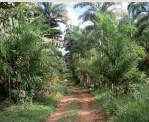
Une forêt reconstituée