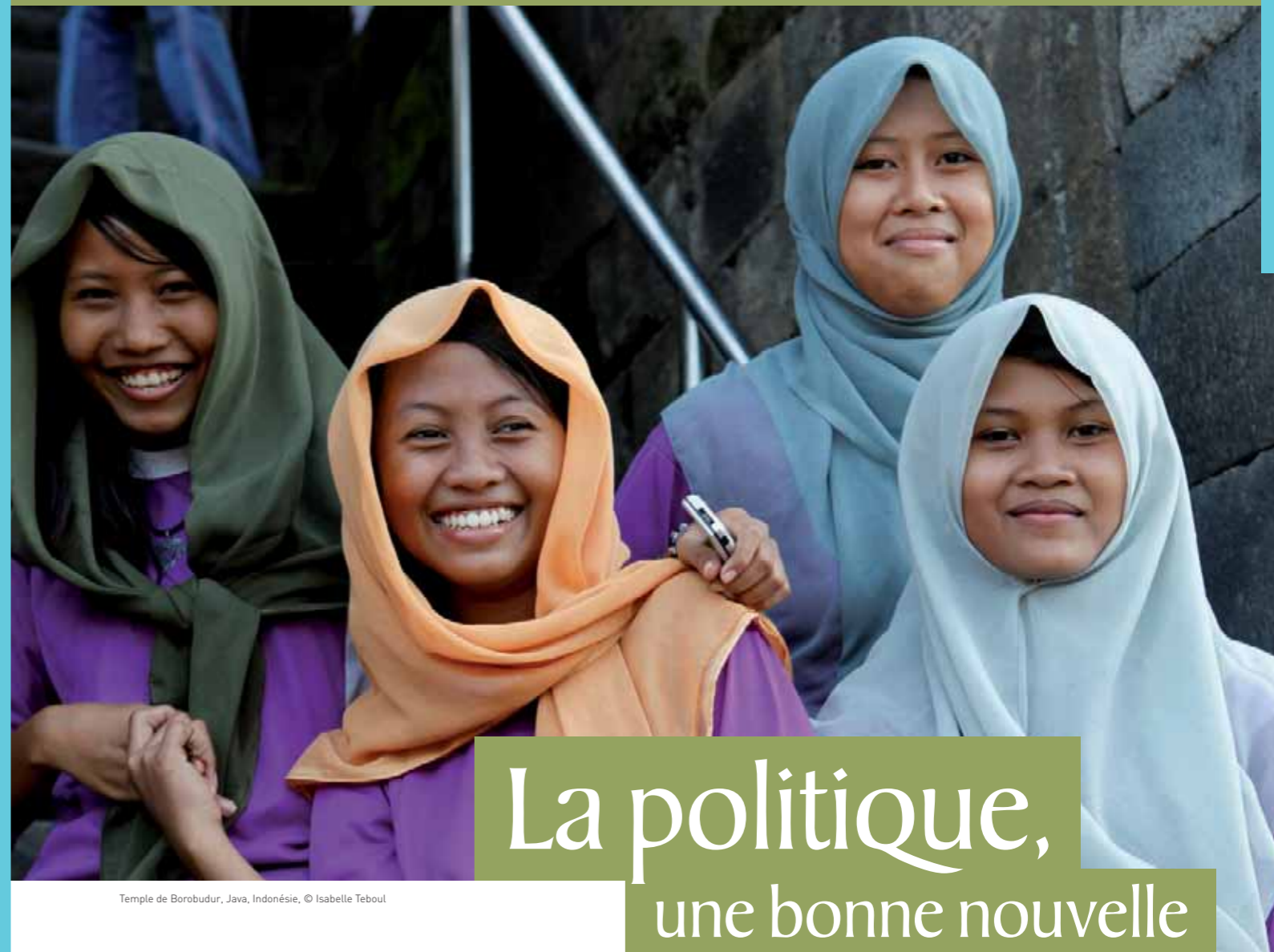
Temple de Borobudur, Java, Indonésie