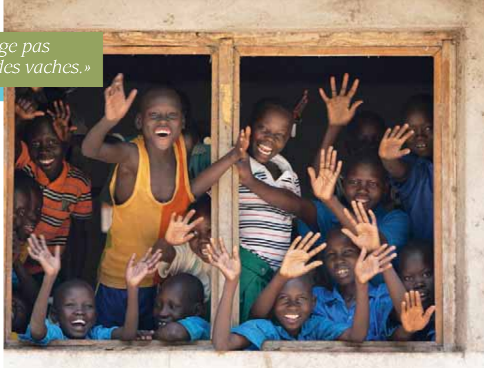
Élèves d'une école catholique, Isohe, Sud Soudan

Les personnes qui s'intéressent à l'Afrique noire s'étonnent de ne pas voir se mettre en mouvement les peuples qui subissent les pires formes de gouvernance depuis de longues années. Le printemps arabe met en perspective les différences notables entre l'Afrique blanche et l'Afrique subsaharienne.