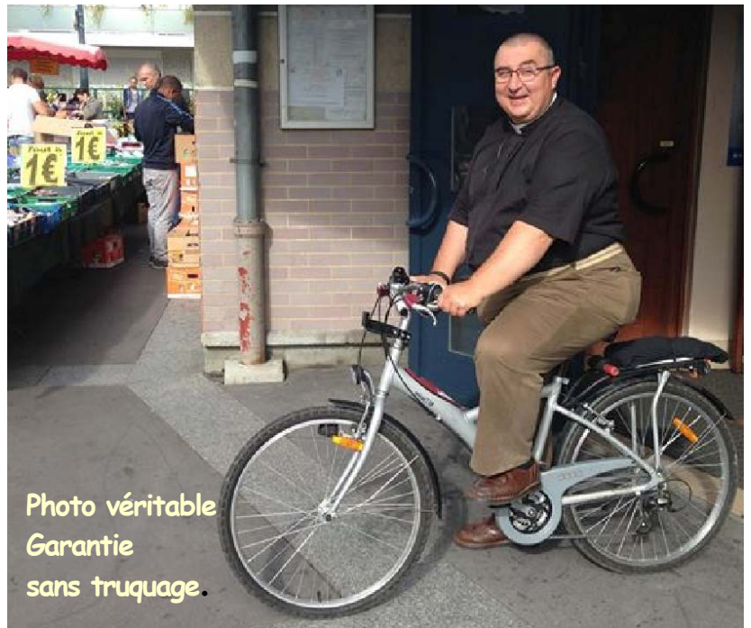
Photo véritable Garantie sans truquage.

Moi non plus, croyez-moi !!! Amitiés à vous tous.