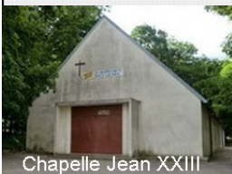
Chapelle Jean XXIII

La chapelle Jean XXIII, située sur le site du Sanctuaire Notre-Dame-des-Anges dont on a fêté les 800 ans en 2012, a été démolie le 5 septembre 2016 pour permettre le passage du futur tramway T4 (T4, qui desservira Les Pavillons-sous-Bois, Livry-Gargan, Clichy-