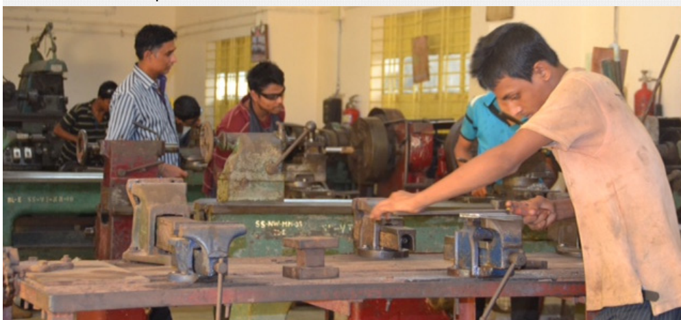
Centre d'apprentissage pour garçons : « SEVA SANGHA ».

Aujourd'hui, nous sommes toujours aussi convaincus de la nécessité de cette solidarité, du choix que nous avons fait de soutenir des initiatives locales, de veiller à l'adaptation de notre aide aux nouvelles réalités sur place. Ainsi, nous allons désormais faire répartir nos dons sur 3 initiatives : Seva Sangha, un orphelinat pour jeunes filles, une école qui accueille des enfants handicapés.