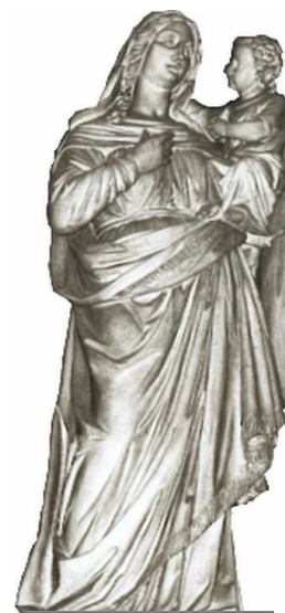
ND des Vertus d'Aubervilliers

Puis nous avons eu une présentation de l'orgue, l'un des plus anciens de notre région. L'organiste nous a expliqué la variété des sonorités de son instrument, les différents « jeux d'orgue ».