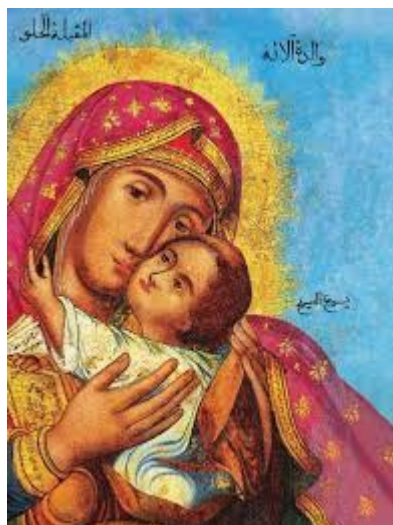
La Vierge embrassant le Doux, icône melkite du XVIIème siècle

Réjouis-toi tu nous ouvres au secret du Dessein de Dieu Réjouis-toi tu nous mènes à la confiance dans le silence Réjouis-toi tu es la première des merveilles du Christ Sauveur Réjouis-toi tu récapitules la richesse de sa Parole