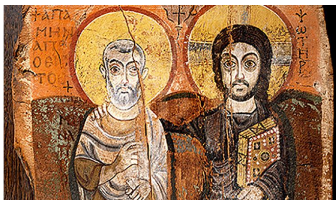
L'ami du Christ (le Christ et saint Mina. 6 e siècle à partir de l'icône de Baouit, Egypte, maintenant au Louvre).

De nos fenêtres ou de nos balcons, en ce temps exceptionnel, nous avons observé le printemps, le renouveau de la nature. Le temps pascal, qui arrive au printemps, est le temps du renouveau de nos cœurs où nous observons tout ce qui est beau, fraternel et innovant autour de nous. C'est le moment de sortir de la routine et de revoir notre manière « d'être en relation », d'être en amitié avec la nature, avec les autres et même avec Dieu.