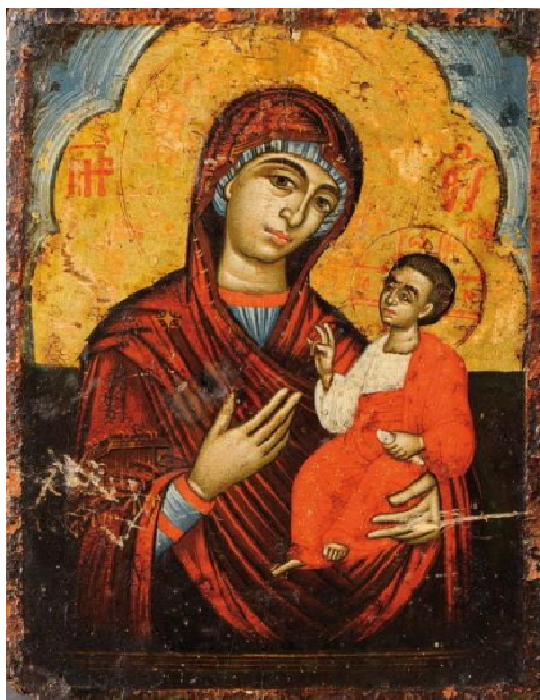
Icône gréco-byzantine, fin 18ème siècle.

La Vierge tient son fils dans son bras gauche et le présente de la main droite pour nous dire qu'il est la porte, il est le chemin qui nous conduit vers le Père.