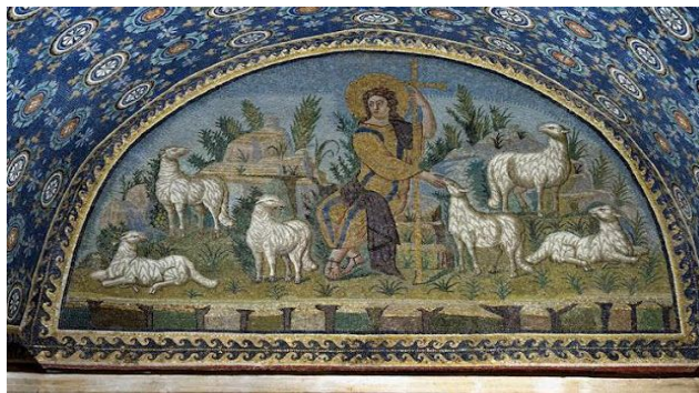
Le bon Pasteur, mausolée de galla Placidia, Ravenne

Aujourd'hui c'est la journée mondiale de réflexion et de prière pour les vocations. Dans notre diocèse, nous vivons « l'année de l'appel », « Tous baptisés, tous appelés ». La vocation est une réponse libre à un appel gratuit du Seigneur, une réponse éclairée et stimulée par l'Esprit Saint. La communauté chrétienne est appelée à prier pour ceux qui ont un choix de vie à faire afin qu'il trouve le courage de dire oui.