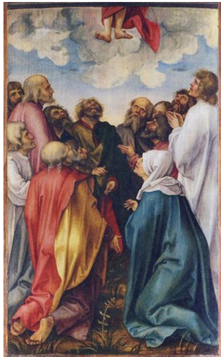
Hans Von Kulmbach (1480-1522)

« Le Verbe s'est fait homme pour que nous devenions Dieu; il s'est rendu visible en son corps pour que nous nous fassions une idée du Père invisible ; il a supporté les outrages des hommes afin que nous ayons part à l'immortalité. » (Saint Athanase d'Alexandrie, Père de l'Eglise universelle)