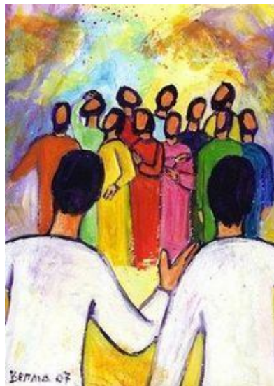
Peinture Berna – Evangile et Peinture

2. Fils du Dieu vivant, ouvre notre cœur, Pour mieux accueillir ta Grâce et ta Lumière. Fais grandir la foi de tous les croyants, Source d'espérance, Jésus Christ Sauveur !