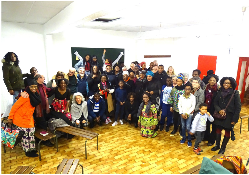
Messe, buffet et soirée préparés par des paroissiens originaires d'Afrique, samedi 20 janvier