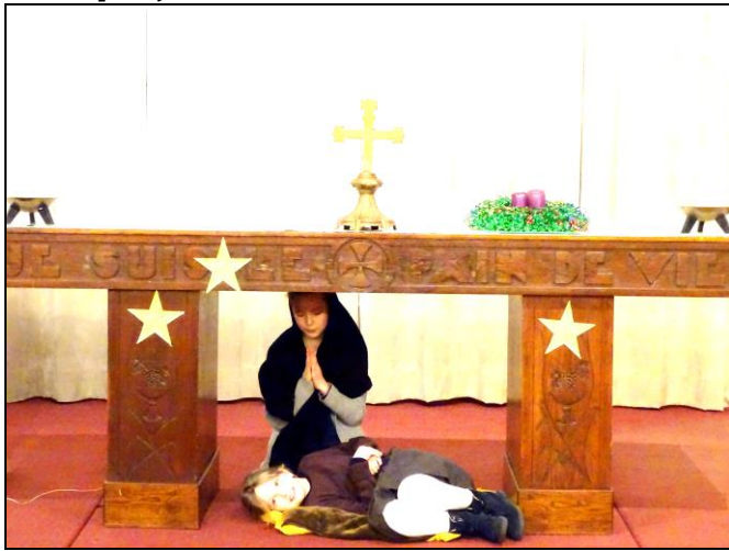
La Nativité vue par les enfants du caté, le 16 déc.