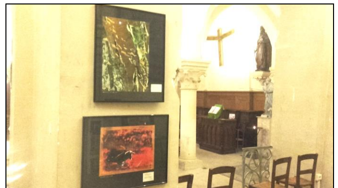
Exposition Correspondance(s) par E. Deloges (auteur) et X. Renard (peintre) à St Pierre St Paul.