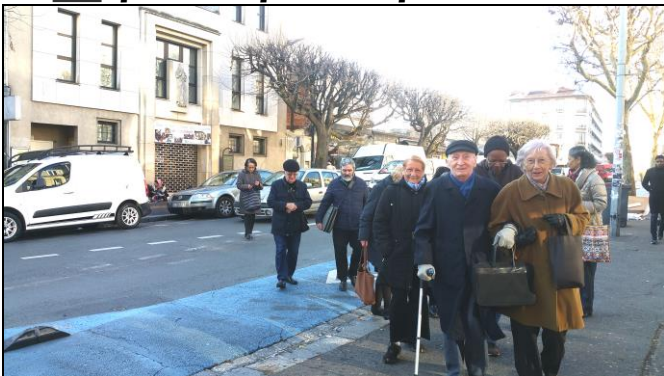
Des bénévoles de St Antoine ont fêté Noël autour d'un bon repas, le 13 décembre.