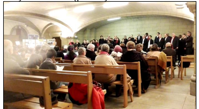
Très beau concert de Noël du Grand Chœur du Conservatoire à St André, le 14 décembre.