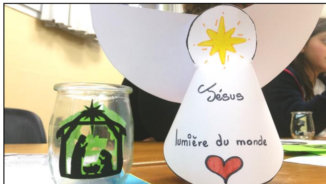
Ateliers de préparation à la Nativité, le 16 déc.