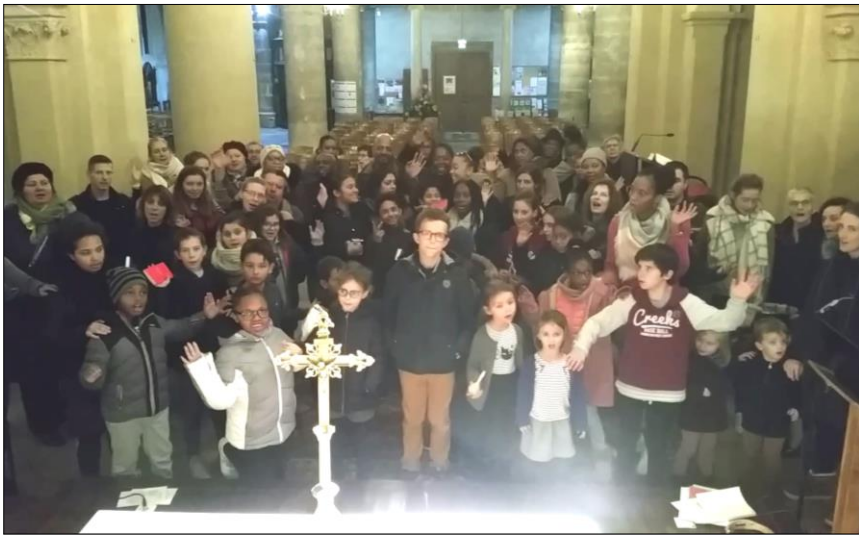
Assemblée de louange à St Pierre St Paul, avec de futurs baptisés (12 décembre)