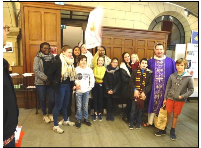
Des Méjistes montreuillois présents au temps fort.