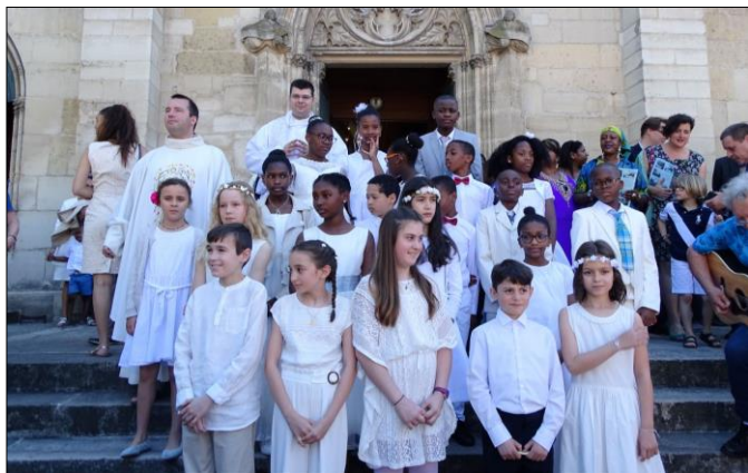
1 ère communion à St Pierre St Paul, le 2 juin.