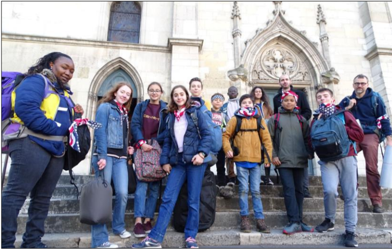
Départ pour le FRAT de Jambville, 111 ème édition, Soyons saints !