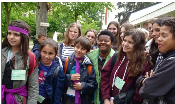
Collégiens montreuillois à Lisieux avec des milliers d'autres franciliens.

Je rêve de solidarité, Où tout le monde pourrait s'entraider, Et la Paix, y être partagée et louée, Pour cela tous les jours j'ai prié. Collégiens & lycéens Aumônerie ND des Foyers