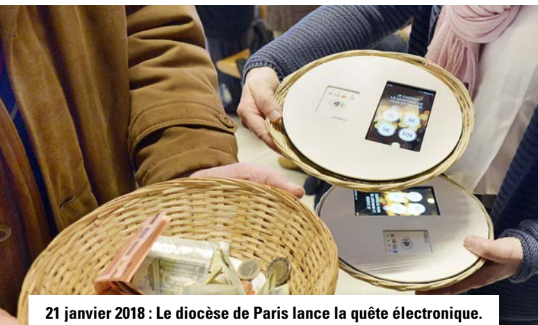
21 janvier 2018 : Le diocèse de Paris lance la quête électronique. Les fidèles peuvent faire un don sans contact avec leur carte bancaire.