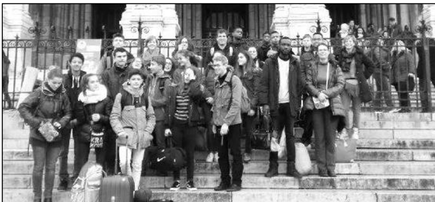
Retraite du groupe de confirmands au centre Ephrem à Montmartre ces 5 et 6 novembre