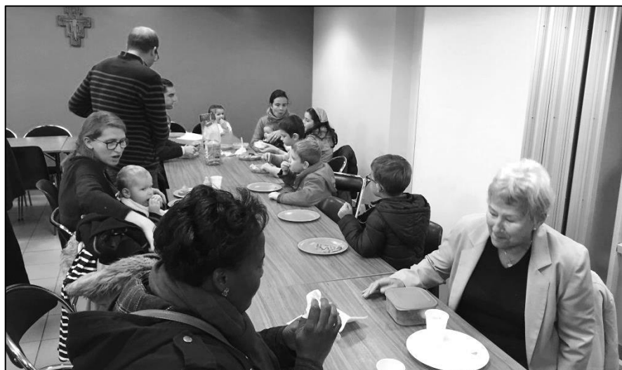
Déjeuner "tiré des sacs" avec les adorateurs et leurs familles ce dimanche 13 novembre à la Maison Jeanne de France Un beau moment de détente et de partage