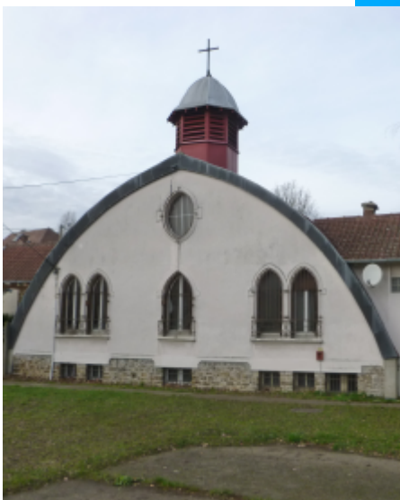
Eglise Notre-Dame d'Espérance