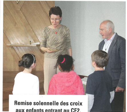
Remise solennelle des croix aux enfants entrant au CE2.

« A ujourd'hui, nous sommes à Jérusalem, 50 jours après Pâques ». Sans savoir où se trouve exactement cette ville, les 20 enfants suivent l'aventure que Marianne leur raconte, celle de la Pentecôte, en ce 3 juin.