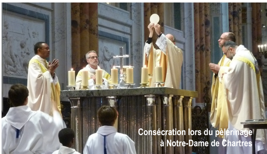
Consécration lors du pèlerinage à Notre-Dame de Chartres

Notre vie spirituelle s'enrichit par notre présence et notre fidélité à Jésus. La messe doit se vivre non pas parce que nos humeurs et nos désirs nous le permettent mais parce que Jésus nous y attend. Il s'est donné par Amour et cela est le cœur même de la messe. Le Christ nous veut à ses côtés, parce que lui fut capable de se donner entièrement. Il espère notre fidélité, que nous recevions le don gratuit de sa vie. « Ceci est mon corps, ceci est mon sang livré pour toi » nous dit Jésus à chaque messe. La consécration nous montre la grandeur de l'Amour de Dieu pour nous. Comment ne pas être marqué par de telles paroles, le don total et vrai de sa vie. Lui nous aime et nous permet de communier dans cet Amour. Il nous faut accepter et recevoir au-delà de nos envies ce cadeau, nous nous devons d'aller à la rencontre de Jésus eucharistie chaque semaine !