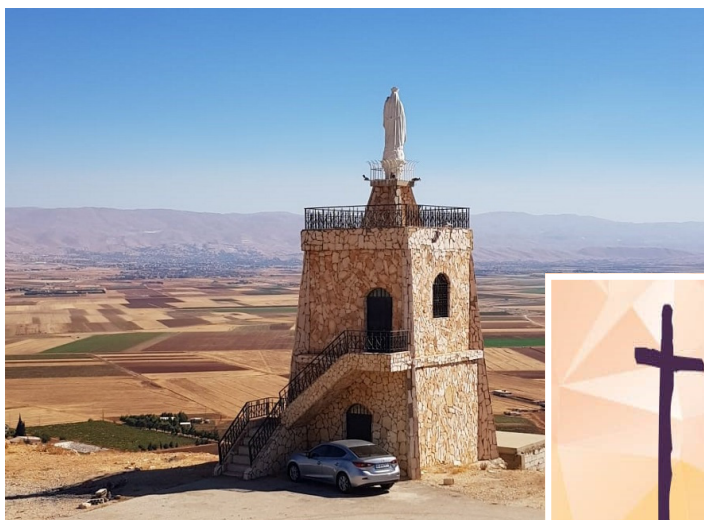
Père Roukoz BARRAK (Vicaire pour les paroisses du Plateau)

C'est une Église qui a beaucoup souffert, ses patriarches pendant les persécutions se sont réfugiés dans les grottes de la haute montagne du Liban. Ses chants ont un ton triste, ses églises sont simples et ses fidèles sont pratiquants, même les jeunes sont toujours fidèles à l'église.