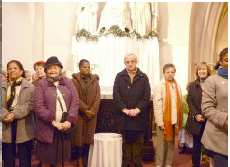
... et à Montfermeil, une semaine plus tard, le 17 octobre