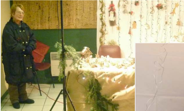
Marché de Noël 4-5 déc. Montfermeil