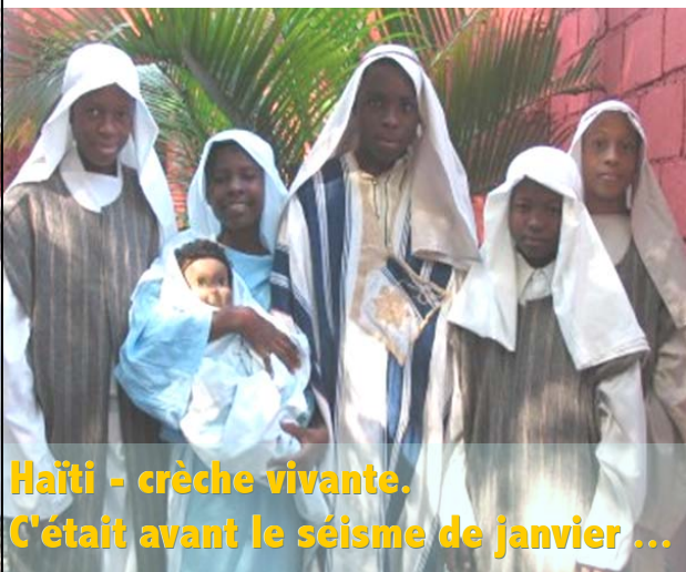
Haïti - crèche vivante. C'était avant le séisme de janvier ...

'est Noël, la plus belle nuit du monde ! Les airs de fête connus de tous et de chacun se font entendre ; on dirait qu'une joie immense traverse le monde. La joie annoncée par la voix des anges, la Bonne nouvelle d'une Naissance tant attendue par l'humanité en quête de nouveauté, affamée de justice et de lumière : « Le peuple qui marchait dans les ténèbres a vu se lever une grande lumière ... ». Debout ! Resplendis Jérusalem ! Un cri prophétique et poétique d'Isaïe, qui apporte un ouf de soulagement, un souffle de Gloria à la terre, qui cherche la Paix comme un rêve devenu réalité au cœur de la famille humaine assoiffée d' In excelsis .