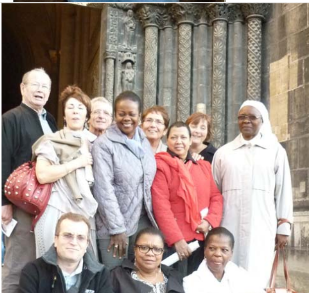
« envoi en mission » des engagés en paroisses - basilique St Denis