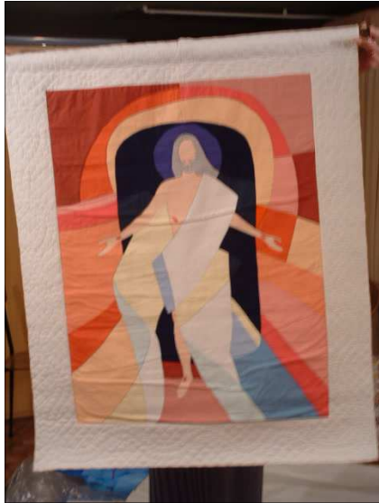
Jésus Ressuscité, dessin de J.F. Kieffer. 100 cm / 87 cm.