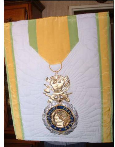
Médaille militaire 79 cm / 66 cm. Travail offert à son mari, le jour où il est devenu président de l'Association des médaillés militaires. Témoignage de respect et d'admiration.