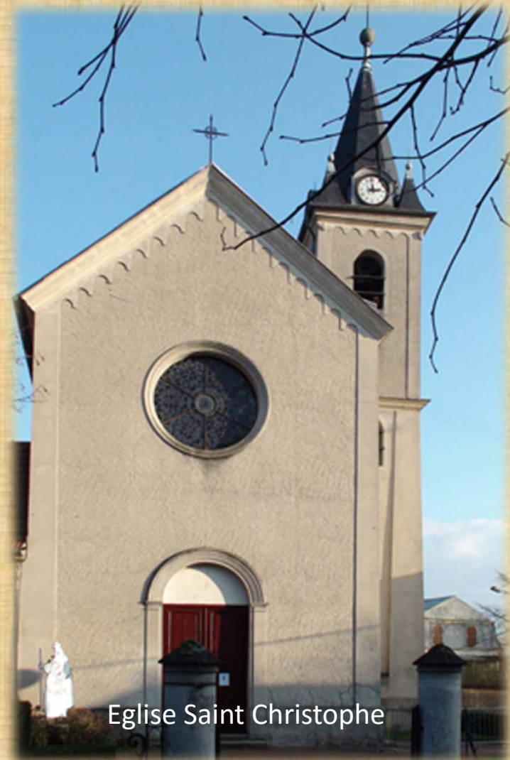
Eglise Saint Christophe