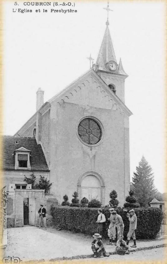
5. COUBRON (S.-&O.) L'Eglise et le Presbytère

Cette église s'appelait au départ "Saint Jacques et Saint Christophe". Eglise du XIIIème siècle (1201 !) reconstruite en 1854 dans le style d'origine et bien entretenue depuis.