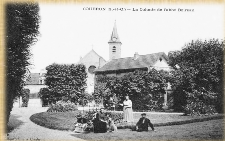
Hauteville à Coubron