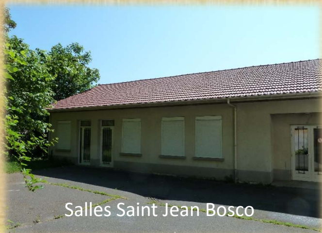
Salles Saint Jean Bosco

1989 – Le diocèse désireux de prendre en charge l'Accueil Saint Jean Baptiste ne nous permet plus de disposer de salles pour les catéchismes et réunions. De nouvelles salles sont construites sur le terrain du presbytère.