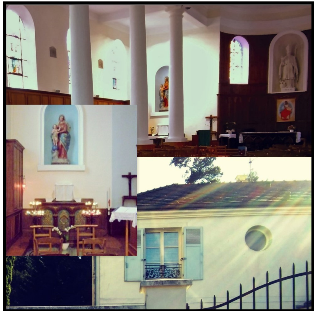
Vue de l'intérieur de l'église St Nicolas et extérieur du nouveau presbytère

Il accueille nos activités pastorales mais reste un lieu de vie ouvert à l'ensemble de nos paroissiens.