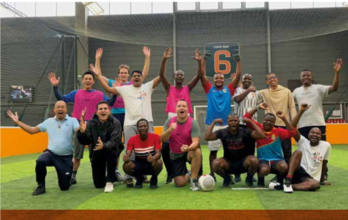
Depuis deux ans, nos prêtres se donnent rendez-vous chaque mois pour un match de football, au cours d'une journée alliant fraternité, convivialité et compétition sportive. Rencontre du 30 octobre, à Aubervilliers.