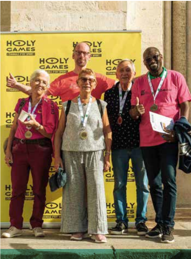
Joie de remporter une médaille bien méritée après quelques kilomètres à pied ou au pas de course !