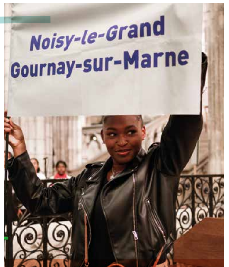
À la saint Denis, toutes les unités pastorales étaient représentées à la messe et ont participé aux épreuves sportives.