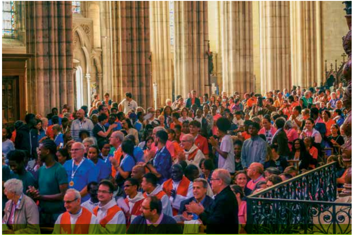
La célébration eucharistique qui a succédé aux épreuves sportives, à la saint Denis, a rassemblé près de deux-mille fidèles.