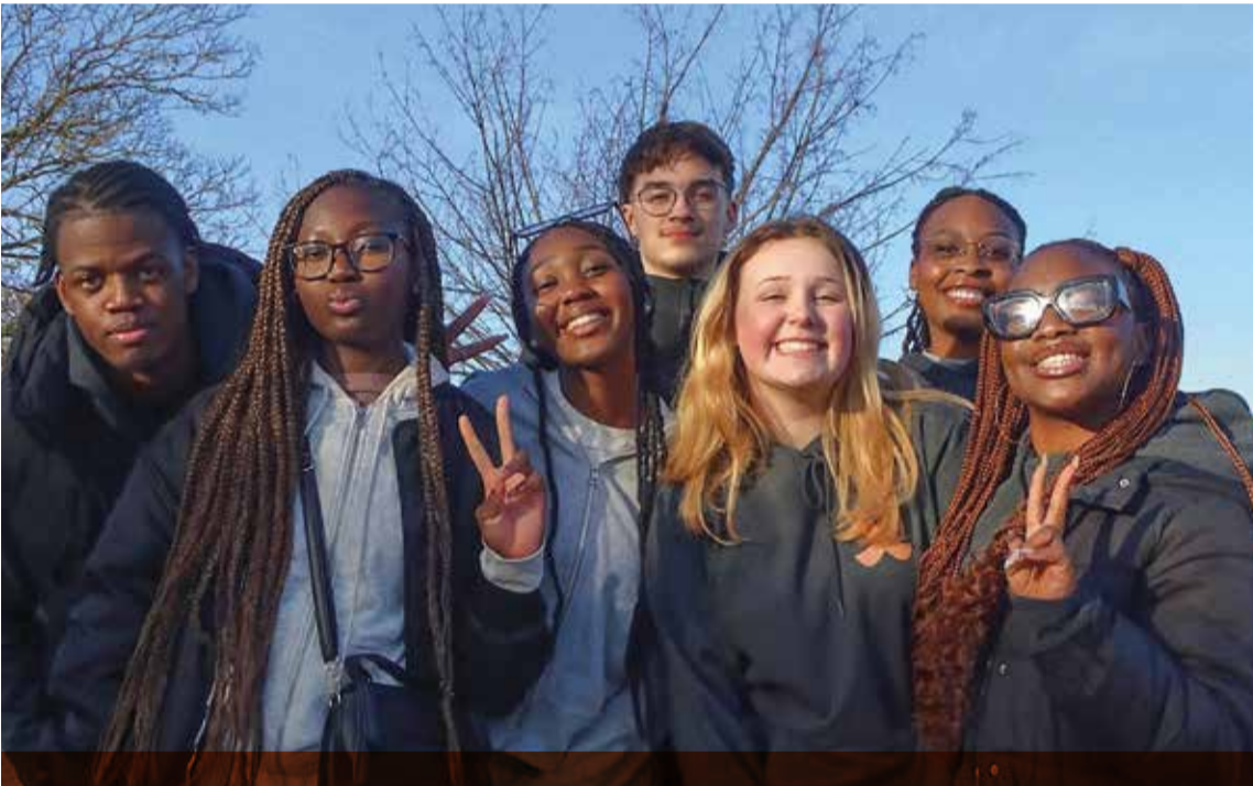
Taizé 2024 - Une équipe de service heureuse d'avoir accompli sa tâche au service de tous les retraitants et des frères de Taizé.