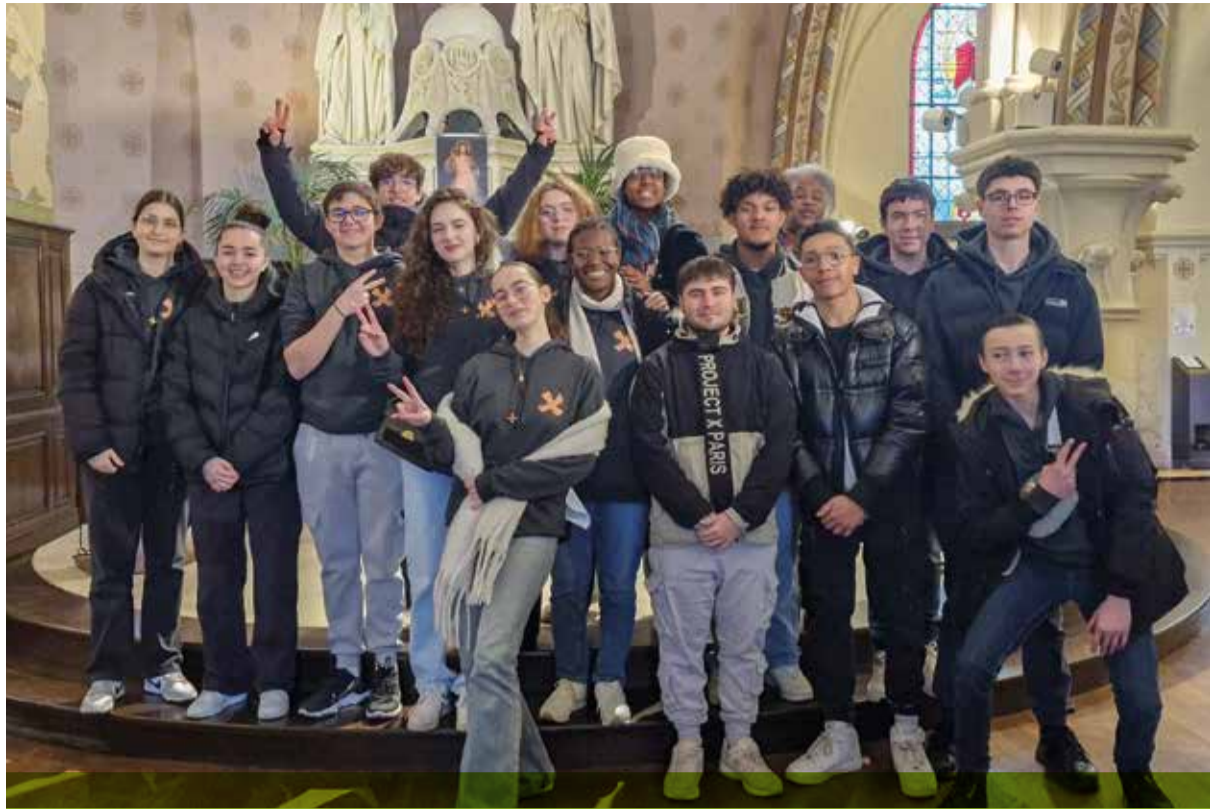
Taizé 2024 - Retour en paroisse, après le pèlerinage. Les jeunes de Montfermeil restent dans la dynamique Taizé !