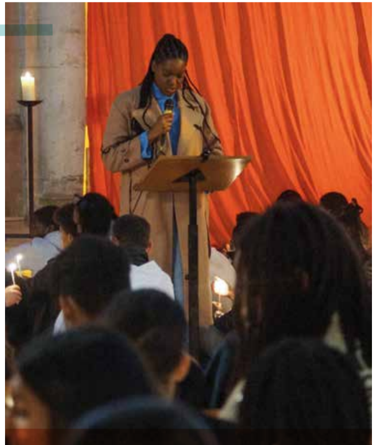
Taizé 2024 - Retrouvailles, le 16 mars, de plus de quatre-cents jeunes pèlerins en l'église Sainte-Marthe-des-Quatre-Chemins à Pantin, auprès de la communauté de frères implantée sur place.