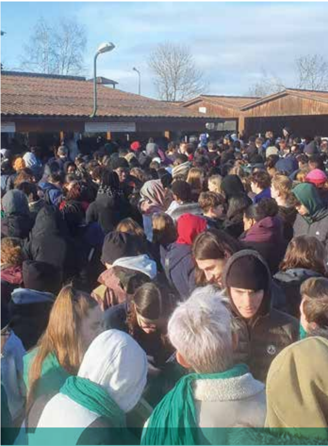
Taizé 2024 - Après l'effort, le réconfort... Les jeunes font la queue pour une pause déjeuner bien méritée !