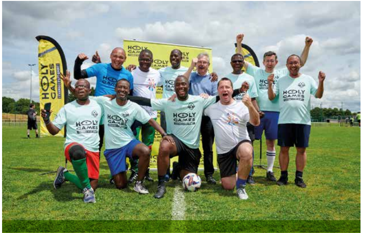
L'équipe de foot des prêtres du diocèse a tout donné le 17 juin à Villepinte, durant la Pater Cup, championnat de football et pétanque des prêtres d'Ile-de-France.