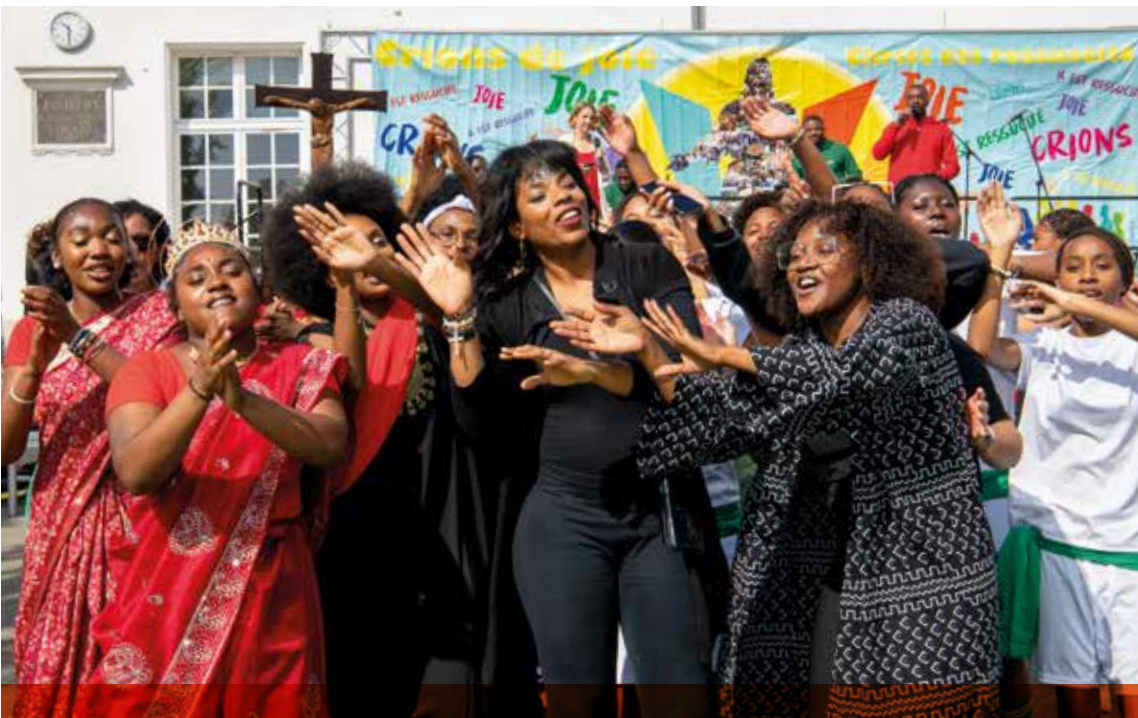
La fête, le sport, la ferveur et la joie étaient au rendez-vous le 25 mai, lors du rassemblement diocésain à Vaujours. Sans oublier le soleil, radieux !