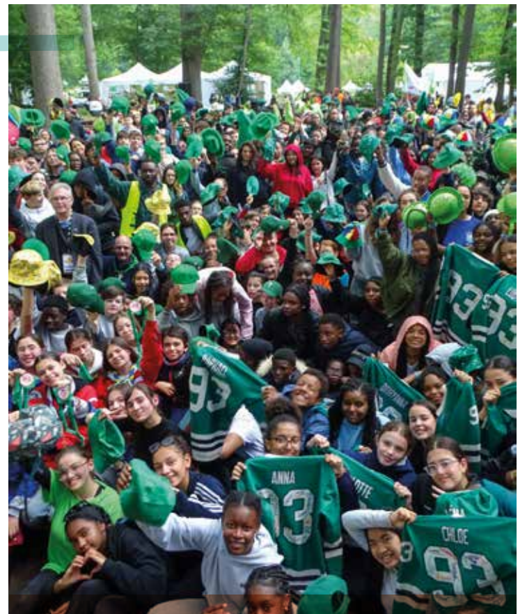
Durant le week-end de la Pentecôte, 11 500 collégiens de 4 e et 3 e , dont plus de 600 jeunes du diocèse, se sont réunis à Jambville pour vivre ensemble le FRAT 2024.

POUR L'ÉGLISE, ILS SERVENT SANS COMPTER, POUR LE RESTE, ILS ONT BESOIN DE VOUS