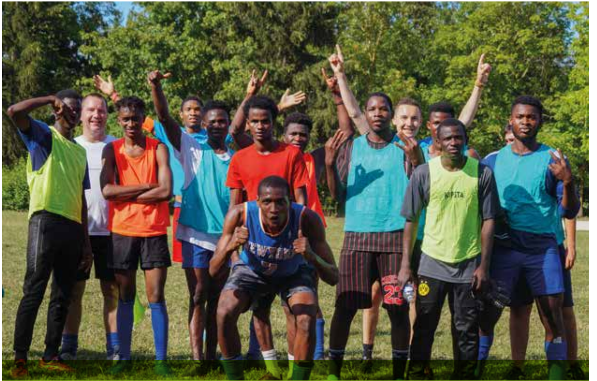
Vendredi 9 août, dans le cadre des Jeux, l'équipe « Holy Games » de Saint-Denis a rassemblé une vingtaine de mineurs isolés de toute l'Île-de-France pour un match de foot, à L'Île-Saint-Denis.