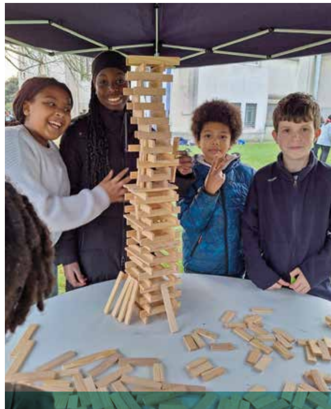
En novembre, 305 jeunes de 6/7 e et une quarantaine d'animateurs venus de quinze villes du diocèse se sont rassemblés aux Pavillons-sous-Bois pour une belle journée autour du thème « Espérer, c'est vivre... Vivre, c'est espérer ».