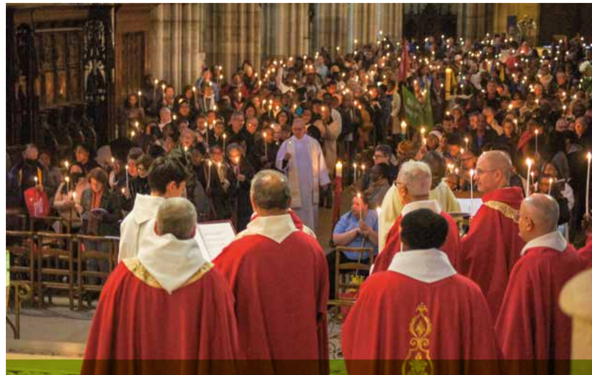
Le 13 octobre, les fidèles se sont rassemblés pour célébrer la fête de notre saint patron, Denis, et la fin de l'année diocésaine « Sport & Foi », en la basilique-cathédrale Saint-Denis.