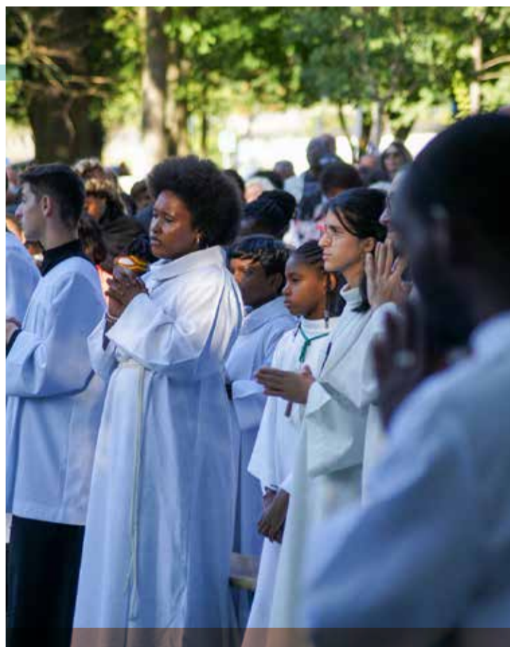
Plus d'un millier de personnes a participé au pèlerinage diocésain annuel de Notre-Dame-des-Anges à Clichy-sous-Bois, une tradition qui se perpétue depuis l'an 1212.